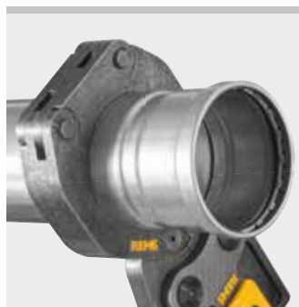
Anello a pressare REMS (PR-3B)