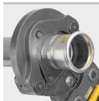
Anello a pressare REMS (PR-3S)