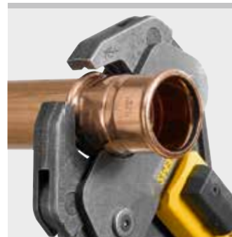
Pinza a pressare REMS (4G)