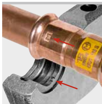
Esempio pinza REMS M: Marchio "M" sulla giunzione pressata per la traccia- bilità secondo EN 1775:2007