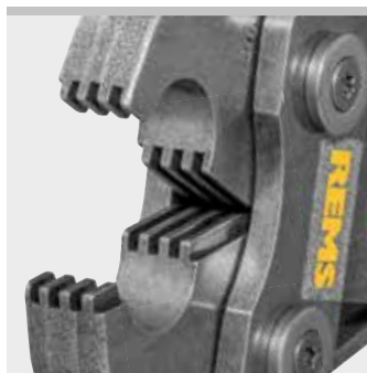
Pinza a pressione con dentatura Brevetto EP 2 027 971