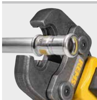
Pinza a pressare REMS