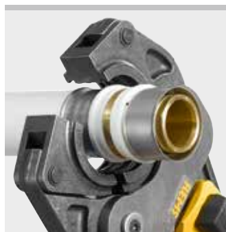
Pinza a pressare REMS (S)