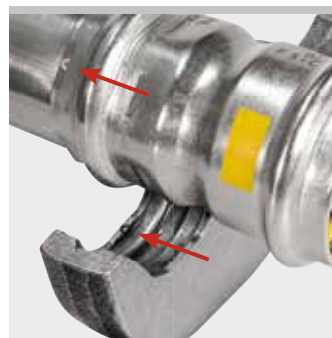
Esempio minipinza REMS V: Marchio "V" sulla giunzione pressata per la tracciabilità secondo EN 1775:2007