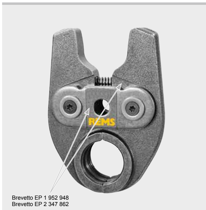
Brevetto EP 1 952 948 Brevetto EP 2 347 862

Con questo sistema di tracciabilità REMS si adegua alle indicazioni previste nella Normativa EN 1775:2007 relativa all'installazioni di sistemi di pressfitting per il gas.